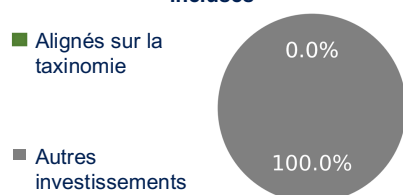
1. Alignement des investissements sur la taxinomie, obligations souveraines incluses*